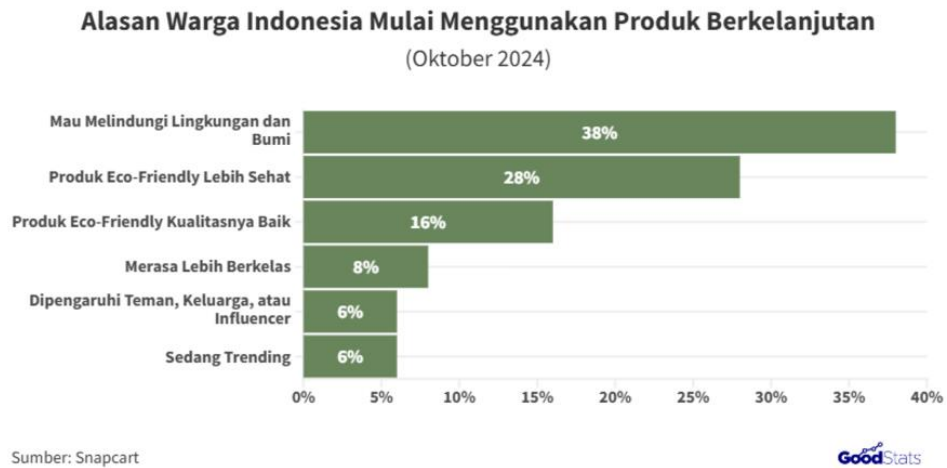
Gambar 1.2 Data Survei Alasan Memilih Produk Ramah Lingkungan 2024

tingginya tuntutan konsumen dalam kebutuhan atas produk-produk yang ramah lingkungan (Yonatan, 2024a).